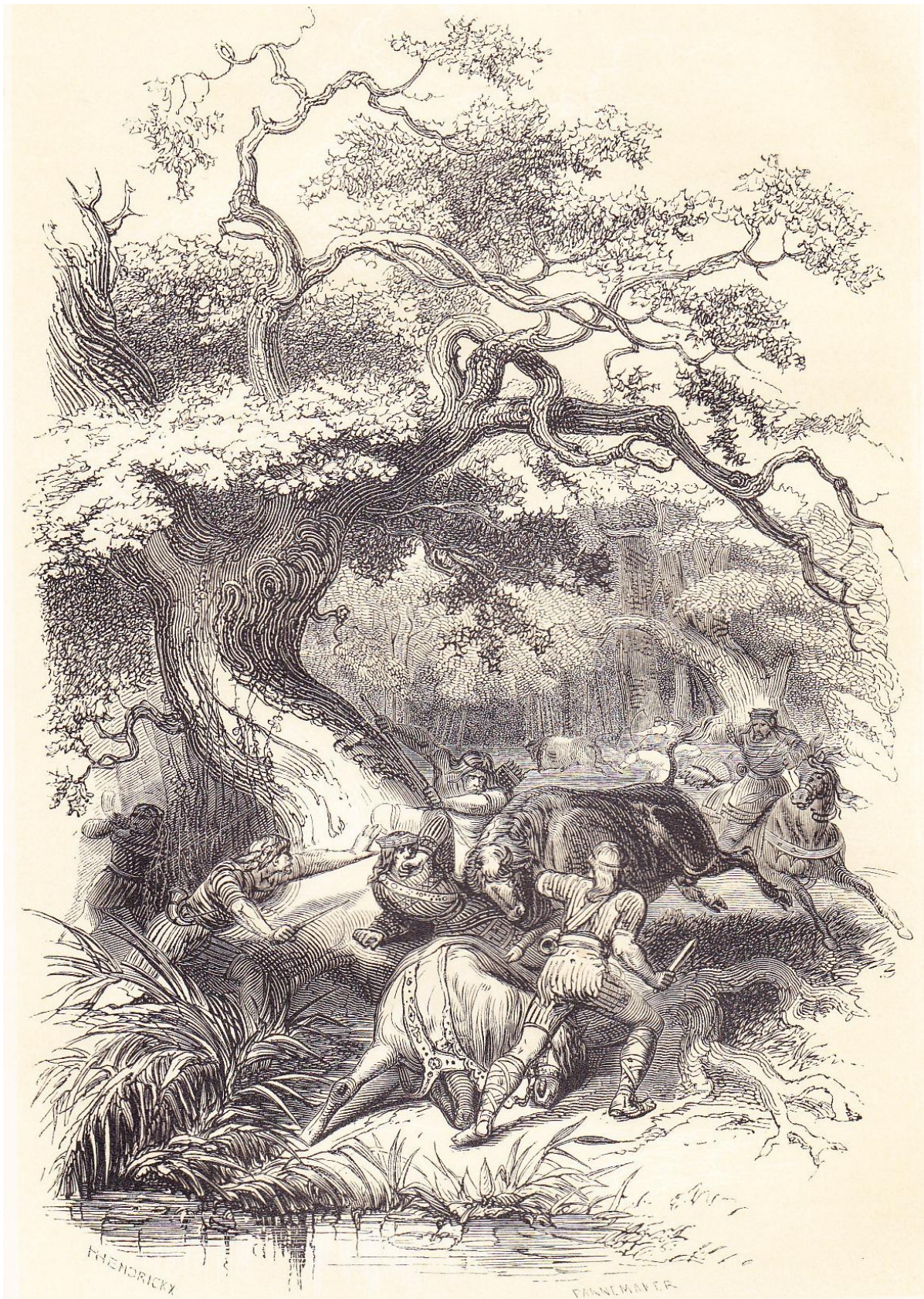
Mort de Théodoric.